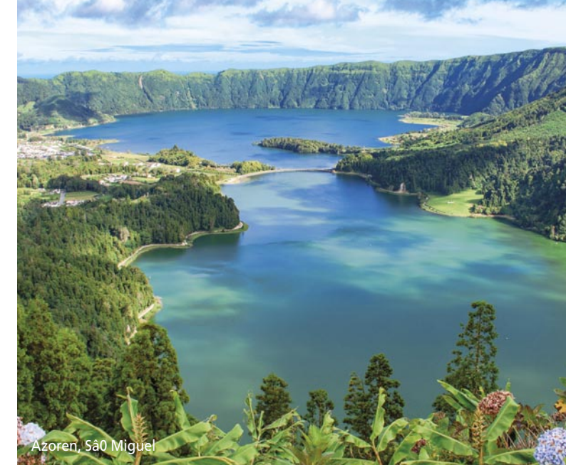
Azoren, São Miguel

Veranstalter der Reise: Phoenix Reisen GmbH, Pfälzer Str. 14, 53111 Bonn