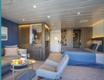
2-Bett-Suite, Balkon, Lido-Deck (Kat. V)