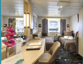
2-Bett außen, Neptun-/Saturn-/Orion-/Apollo-Deck (Kat. I, J, K, M, O, J1, L)