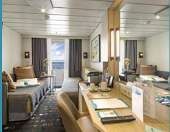
2-Bett-Superior, Balkon, Orion-/Apollo-/Jupiter-Deck (Kat. PG, P, Q, R, Q1)