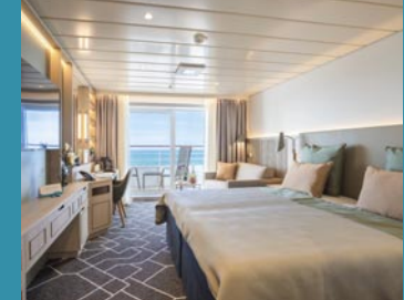
2-Bett-Junior-Suite, Balkon, Jupiter-/Lido-Deck (Kat. S, T)