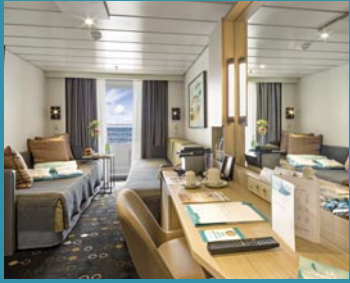
2-Bett-Superior, Balkon, Orion-/Apollo-/Jupiter-Deck (Kat. PG, P, Q, R, Q1)