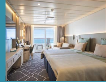
2-Bett-Junior-Suite, Balkon, Jupiter-/Lido-Deck (Kat. S, T)