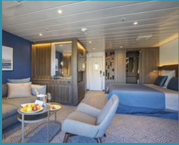
2-Bett-Suite, Balkon, Lido-Deck (Kat. V)