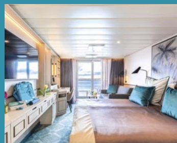
2-Bett-Junior-Suite, Balkon, Panorama-Deck (Kat. T)