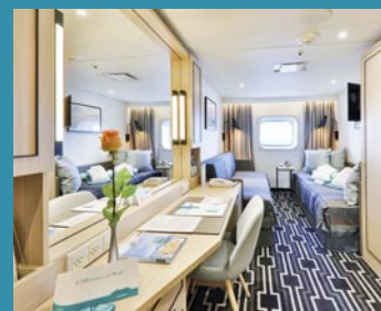
2-Bett außen, Saturn-Deck (Kat. K, L), Orion-Deck (Kat. M)