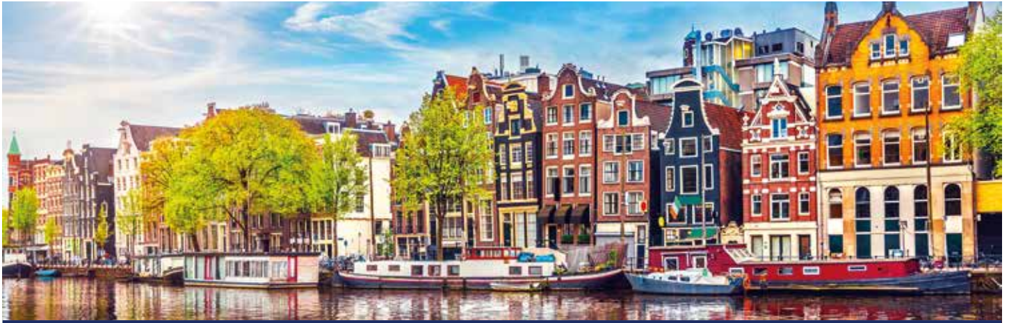
Häuser entlang der Grachten von Amsterdam

Lust auf etwas Neues? Dann fahren Sie mit unserer LADY DILETTA nach Holland und lernen Sie hautnah kennen, was unser neues Schiff Ihnen an Komfort zu bieten hat. Auf dem einladenden Sonnendeck sind Sie live dabei, wenn es heißt: Leinen los! In den Morgenstunden sichten Sie Amsterdam, wo sich schicke Giebelhäuser in den Grachten spiegeln. Klein, aber fein gewinnt auch das idyllische Nijmegen schnell Ihr Herz, bevor Sie es sich am Abend in der eleganten Panorama-Bar unter der Glaskuppel gemütlich machen. Genießen Sie einfach den Rundumblick und freuen Sie sich auf ein Wiedersehen mit unserer LADY DILETTA!