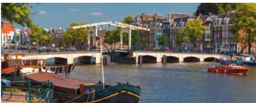
Die Magere Brug in Amsterdam