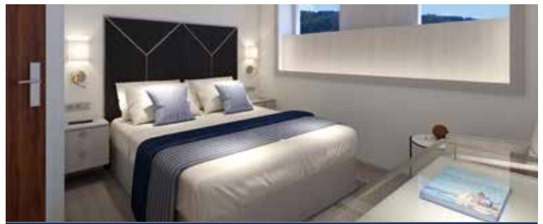
2-Bettkabine Accademia Deck (Modellbild)