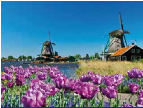
Naturidylle in Holland