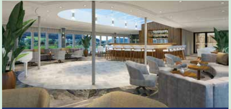
Die helle und freundliche Lounge*