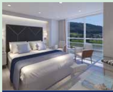
2-Bettkabine mit frz. Balkon*