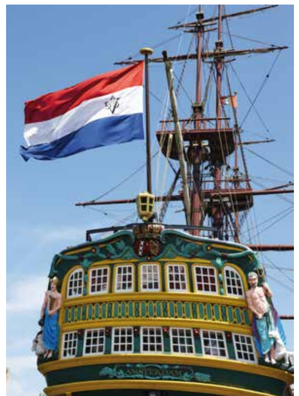
Holländisches historisches Schiff