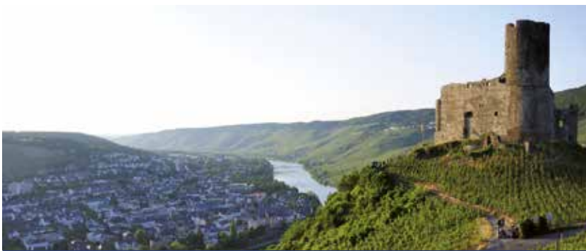
Blick über die Weinrebe auf die Mosel bei Bernkastel

Alle Zeiten sind Richtzeiten. Programmänderungen, auch durch Hoch- und Niedrigwasser, oder Verzögerungen bei Schleusendurchfahrten sind vorbehalten. HT = Halbtagesausflug