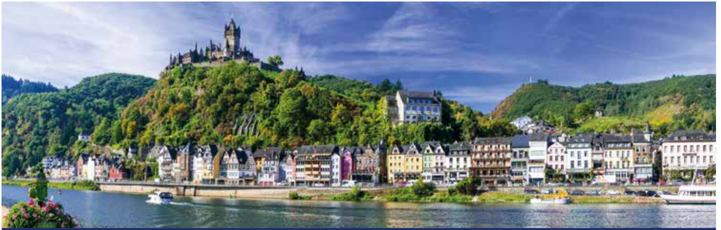
Wunderschönes Panorama an der Mosel in Cochem