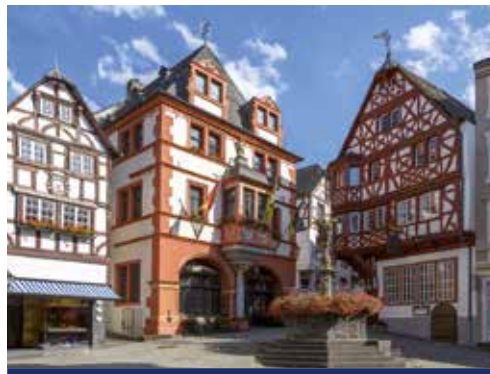
Schöne Fachwerkhäuser in Bernkastel