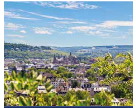
Blick auf das sonnige Trier