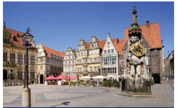
Der Bremer Marktplatz mit Roland