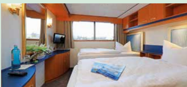
Zweibett-Kabine auf dem Eems-Deck