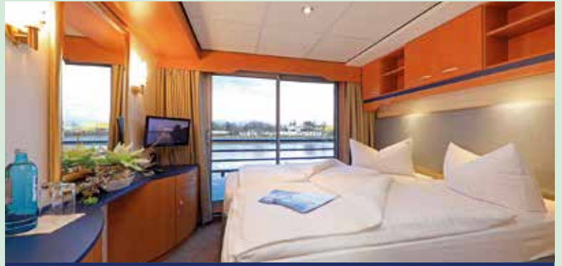
2-Bettkabine mit französischem Balkon