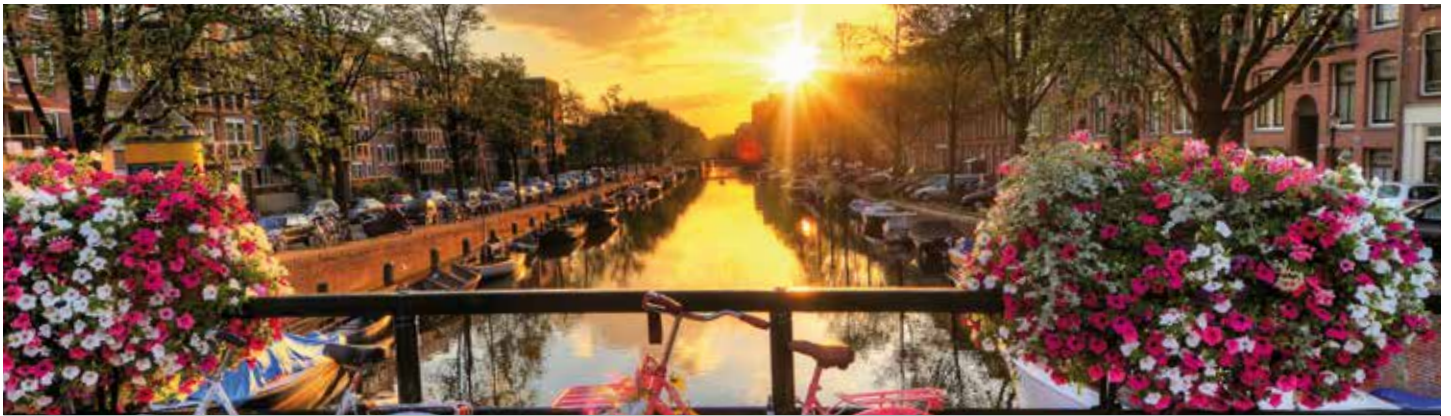
Gracht in Amsterdam