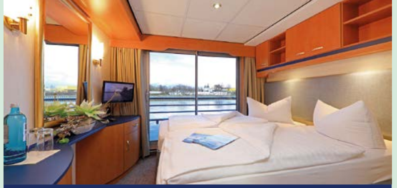
2-Bettkabine mit französischem Balkon