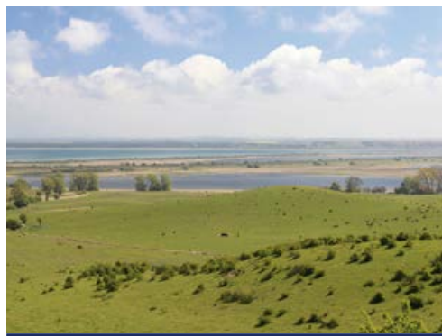
Naturidylle auf Hiddensee