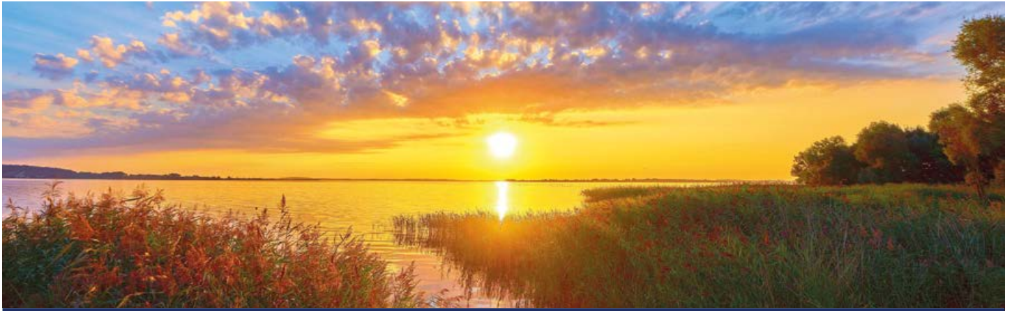
Sonnenuntergang auf Usedom

In Stettin blicken Sie von der Hakenterrasse über die Oder, kreuzen über das Stettiner Haff, spazieren auf Usedom durch die Kaiserbäder und werfen auf Rügen einen Blick vom Kaiserstuhl übers Meer. Spüren Sie die Ostseebrise? Auf Hiddensee die idyllische Landschaft bewundert und in Stralsund die historische Altstadt, entern Sie den Grabower Bodden. Außerdem können Sie die malerische Havel, die spannende Schleuse Lehnitz und das Wunder Schiffshebewerk Niederfinow bewundern.