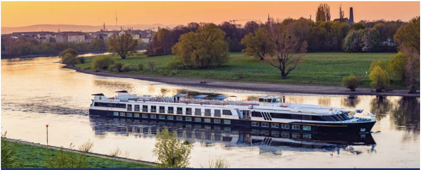
MS SANS SOUCI