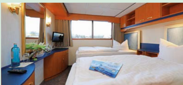
Zweibett-Kabine auf dem Eems-Deck