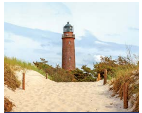
Leuchtturm am Darß