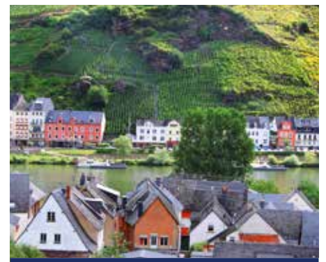
Weinberge an der Mosel