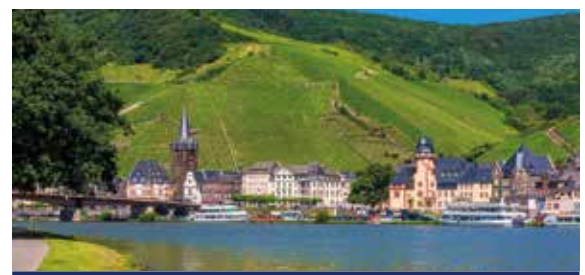
Blick auf Bernkastel