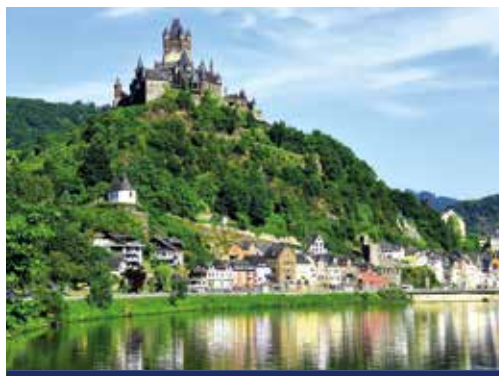
Cochem mit Blick auf die Reichsburg