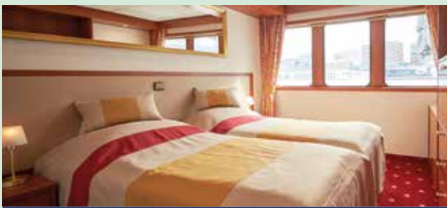
2-Bettkabine auf dem Hauptdeck