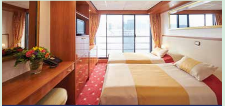
2-Bettkabine mit französischem Balkon