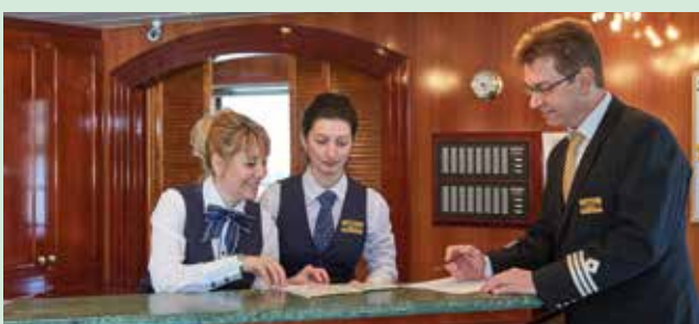
An der Rezeption