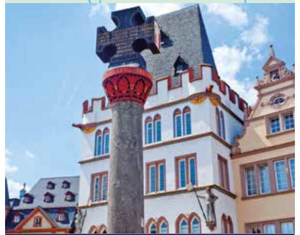
Marktplatz in Trier