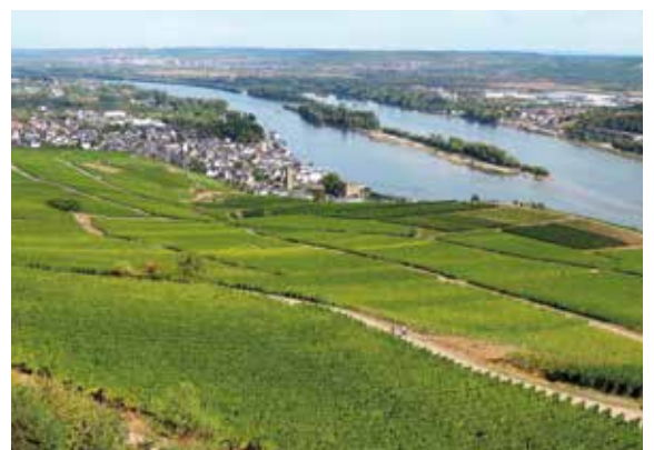
Rhein bei Rüdesheim

Alle Zeiten sind Richtzeiten. Programmänderungen, auch durch Hoch- und Niedrigwasser, oder Verzögerungen bei Schleusendurchfahrten sind vorbehalten.