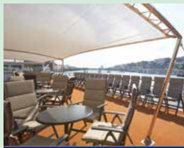
Sonnendeck mit Sonnensegel