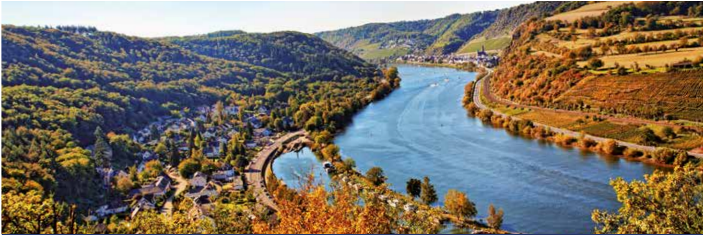
Cochem an der Mosel im Herbst

6 Tage Flusskreuzfahrt vom 21.10. bis 26.10.2021