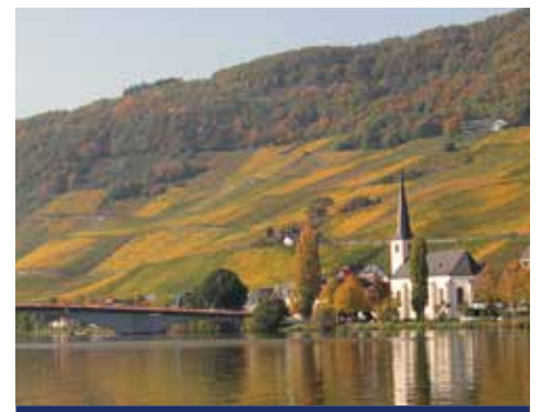
Entlang der Mosel