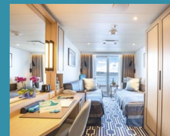
2-Bett-Superior, Balkon, Promenaden-/Lido-/Jupiter-Deck (Kat. O+, P, R)