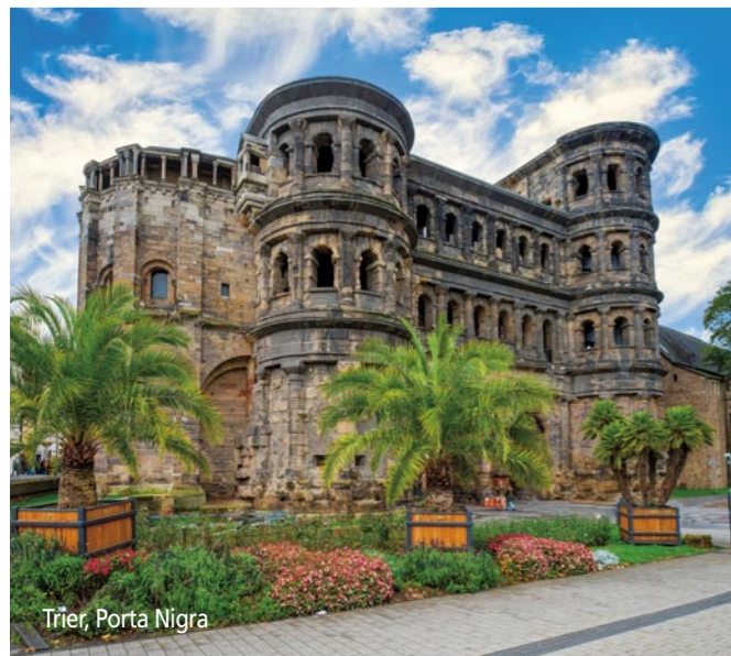
Trier, Porta Nigra