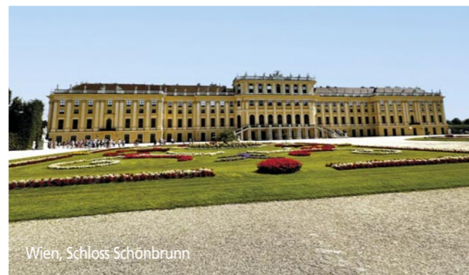
Wien, Schloss Schönbrunn