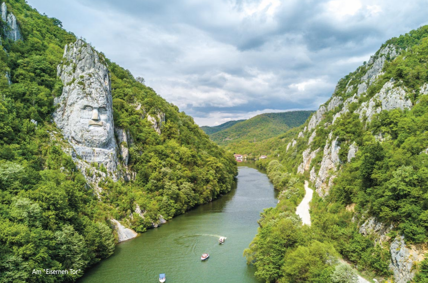
Am "Eisernen Tor"