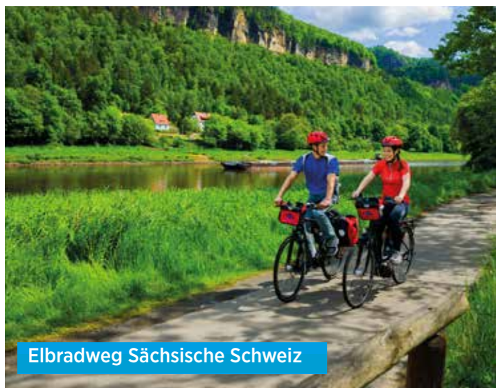
Elbradweg Sächsische Schweiz

Detaillierte Zeiten und Informationen hierzu erhalten Sie mit Ihren Reiseunterlagen.