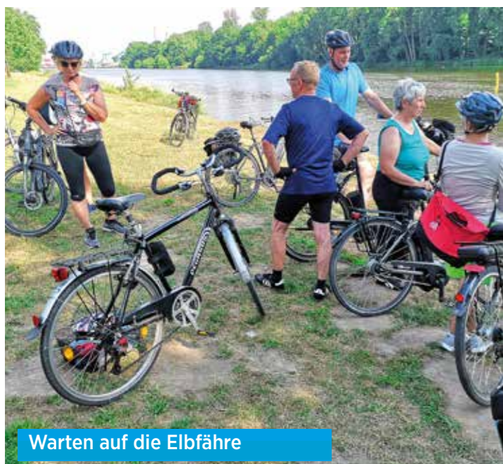
Warten auf die Elbfähre