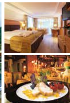
4****Sunstar Alpine Hotel & Spa in Davos