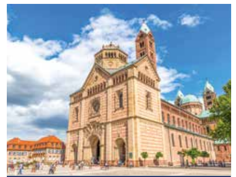
Der Dom zu Speyer ist die größte heute noch erhaltene romanische Kirche