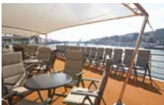
Sonnendeck mit Sonnensegel