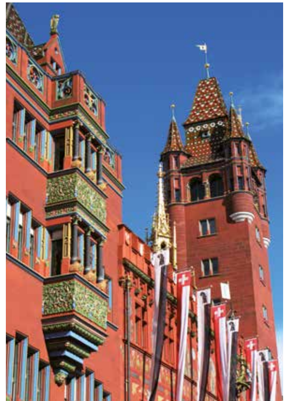
Das imposante Rathaus in Basel

Alle Zeiten sind Richtzeiten. Programmänderungen, auch durch Hoch- und Niedrigwasser, oder Verzögerungen bei Schleusendurchfahrten sind vorbehalten. Das Landausflugsprogramm erhalten Sie ca. 6 Wochen vor Reisebeginn. Die Landausflüge sind nicht im Reisepreis enthalten. HT = Halbtagesausflug A = Abendausflug