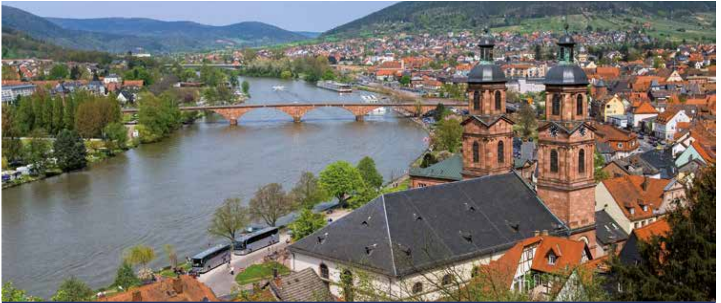
Miltenberg – die Perle am Main

An den Ufern steht der Mai endlich in voller Blüte, während Sie sich an Deck von MS ELEGANT LADY entspannen und sich auf viele kleine Abenteuer freuen: Bestaunen Sie das Basler Münster aus rotem Sandstein, zählen Sie die bunten Wappen am Breisacher Rathaus, fotografieren Sie in Straßburg die romantischen Fachwerkhäuser oder in Speyer den edlen Kaiser- und Mariendom. Mit dem Nibelungenbähnchen durch Worms sausen, in Mainz auf dem 50. Breitengrad balancieren, in Frankfurt über den historischen Römerberg schlendern? Dass Sie auf dieser Reise noch viel mehr Abenteuer erleben, versteht sich von selbst!