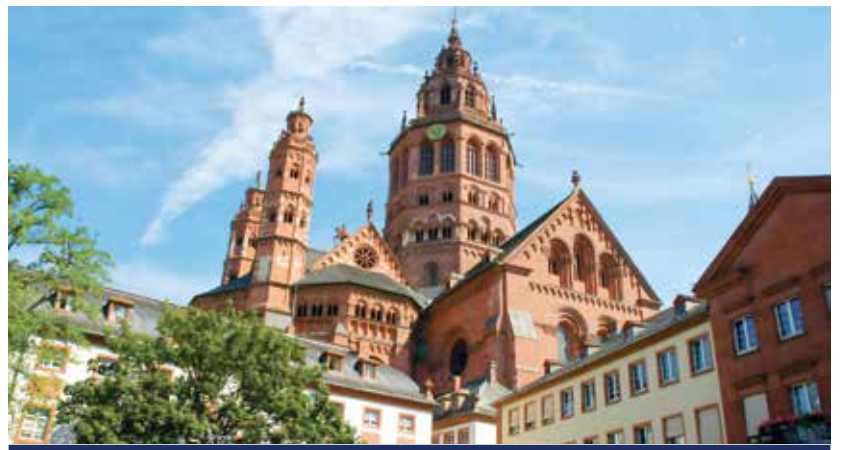
Der Hohe Dom St. Martin zu Mainz