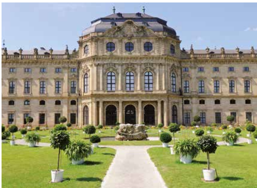
Die Würzburger Residenz ist eines der bedeutendsten Schlösser Europas