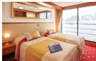
2-Bettkabine mit franz. Balkon