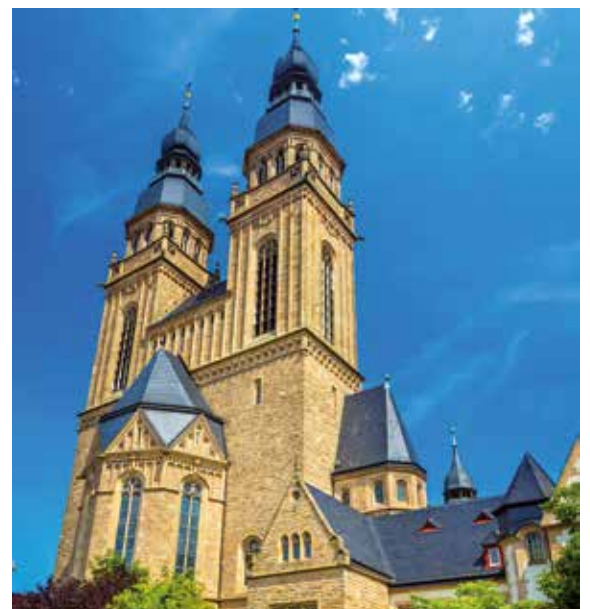
St. Joseph Kirche in Speyer