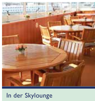
In der Skylounge

Trinkgelder, Landausflüge, zusätzliche Veranstaltungen und private Ausgaben sind nicht im Reisepreis eingeschlossen.