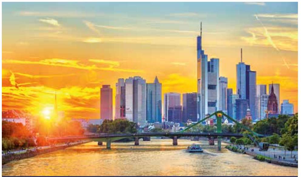
Die Skyline der Bankenmetropole Frankfurt am Main