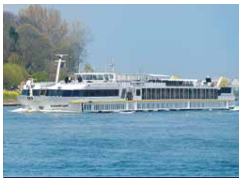
MS ELEGANT LADY – Reisen mit Stil und Komfort