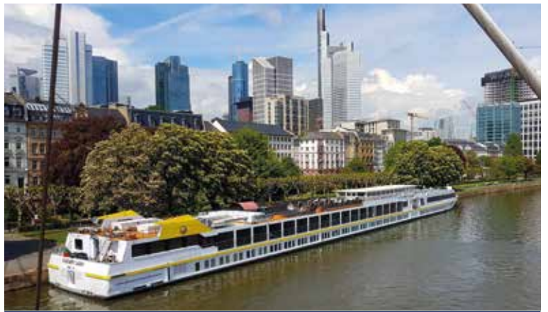
MS ELEGANT LADY in Frankfurt am Main

An den Ufern steht der Mai endlich in voller Blüte, während Sie sich an Deck von MS ELEGANT LADY entspannen und sich auf viele kleine Abenteuer freuen: Bestaunen Sie das Basler Münster aus rotem Sandstein, zählen Sie die bunten Wappen am Breisacher Rathaus, fotografieren Sie in Straßburg die romantischen Fachwerkhäuser oder in Speyer den edlen Kaiser- und Mariendom. Mit dem Nibelungenbähnchen durch Worms sausen, in Mainz auf dem 50. Breitengrad balancieren, in Frankfurt über den historischen Römerberg schlendern? Dass Sie auf dieser Reise noch viel mehr Abenteuer erleben, versteht sich von selbst!