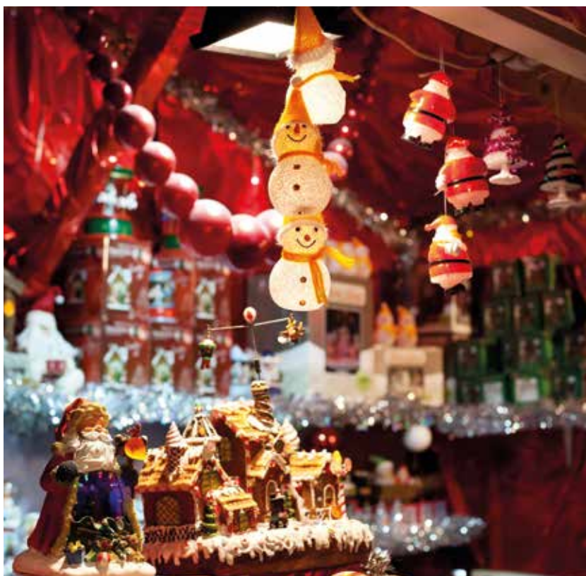
Erleben Sie stimmungsvolle Weihnachtsmärkte