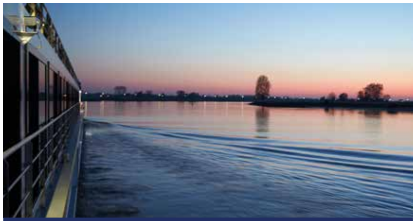
Unterwegs mit der MS ELEGANT LADY