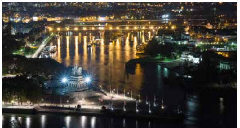
Am weltbekannten Deutschen Eck liegt eine der schönsten und ältesten Städte Deutschlands – Koblenz

Wie das duftet! Nach karamellisierten Bratäpfeln und gebrannten Mandeln, würzigen Lebkuchen und backfrischen Stollen! Von Weihnachtsmarkt zu Weihnachtsmarkt fahren Sie auf Mosel, Rhein und Main. Märchenhaft beleuchtet bewacht die majestätische Reichsburg in Cochem den alljährlichen Sternzauber, während in Koblenz jeden Tag eine andere der 24 Dachgauben des barocken Rathauses in bunten Farben erstrahlt. Nachdem Sie in Rüdesheim etwa 100 nostalgische Weihnachtshäuschen rund um die malerische Altstadt begrüßt haben, überraschen Sie der traditionelle Wiesbadener Sternschnuppenmarkt mit einem riesigen Tannenbaum mit rund 3.000 Lichtern und der Mainzer Markt mit einer 9 Meter hohen Weihnachtspyramide. Welches Highlight ist Ihr Favorit?