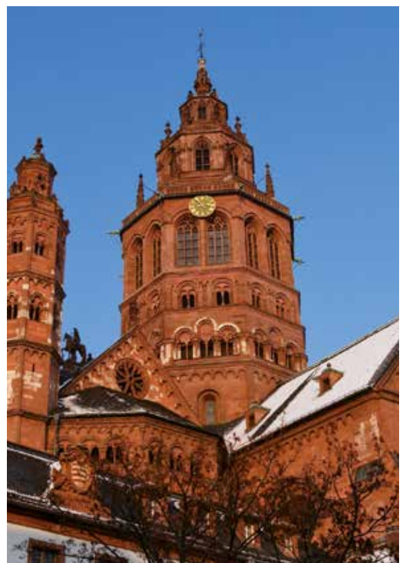
Mainzer Dom von Schnee bedeckt