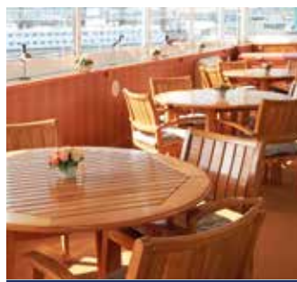
In der Skylounge

Die All inklusive-Getränke werden von 8.00 bis 24.00 Uhr angeboten. Die Getränke werden nur in Gläsern ausgeschenkt. Das Getränke-Paket gilt nicht für Getränke in Flaschen. Alle weiteren Getränke laut den angegebenen Preisen auf der Getränkekarte an Bord.