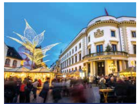
Schönster Lichterglanz auf dem Sternschnuppenmarkt in Wiesbaden