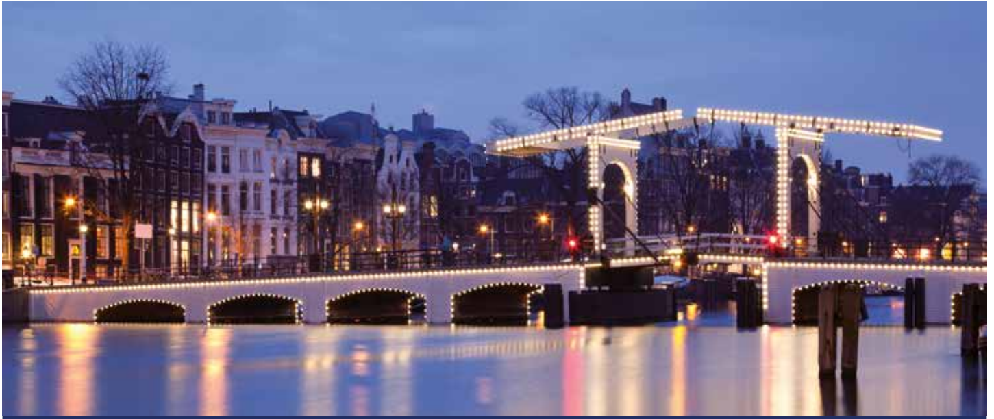
Amsterdam am Abend – einfach magisch

Während glasklare Luft Ihre Lungen füllt, ziehen winterliche Polderlandschaften und beschauliche Orte an Ihnen vorbei: An den Ufern der Schelde sichten Sie in Antwerpen die detailverliebte Liebfrauenkathedrale, am Zusammenfluss von Lieve und Leie bewundern Sie mitten in Gent die Wasserburg Gravensteen und in Brügge die unzähligen Kanäle und Bogenbrücken. Nach einer Tour durch den imposanten Rotterdamer Hafen, die Handelsstadt Delft oder das moderne Den Haag überrascht Sie dann am Abend ein Potpourri aus Licht und Leben: Amsterdam! Während das farbenfrohe Feuerwerk die quirlige Weltstadt noch mehr zum Leuchten bringt, feiern Sie an Bord von MS INSPIRE ausgelassen ins neue Jahr hinein!