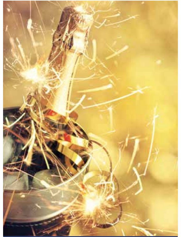
Feiern Sie Silvester mal ganz anders

Alle Zeiten sind Richtzeiten. Programmänderungen, auch durch Hoch- und Niedrigwasser, oder Verzögerungen bei Schleusendurchfahrten sind vorbehalten. **Witterungsabhängig. Sollte Gent nicht angefahren werden können, werden alle Ausflüge von Antwerpen aus organisiert. Das Landausflugsprogramm erhalten Sie ca. 6 Wochen vor Reisebeginn. Die Landausflüge sind nicht im Reisepreis enthalten. HT = Halbtagesausflug