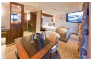
Elegante Suite Kat. 6