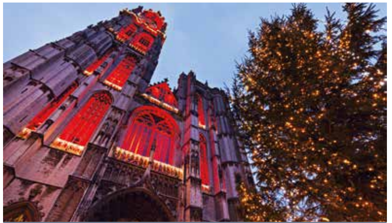
Antwerpen im Lichterglanz

Während glasklare Luft Ihre Lungen füllt, ziehen winterliche Polderlandschaften und beschauliche Orte an Ihnen vorbei: An den Ufern der Schelde sichten Sie in Antwerpen die detailverliebte Liebfrauenkathedrale, am Zusammenfluss von Lieve und Leie bewundern Sie mitten in Gent die Wasserburg Gravensteen und in Brügge die unzähligen Kanäle und Bogenbrücken. Nach einer Tour durch den imposanten Rotterdamer Hafen, die Handelsstadt Delft oder das moderne Den Haag überrascht Sie dann am Abend ein Potpourri aus Licht und Leben: Amsterdam! Während das farbenfrohe Feuerwerk die quirlige Weltstadt noch mehr zum Leuchten bringt, feiern Sie an Bord von MS INSPIRE ausgelassen ins neue Jahr hinein!