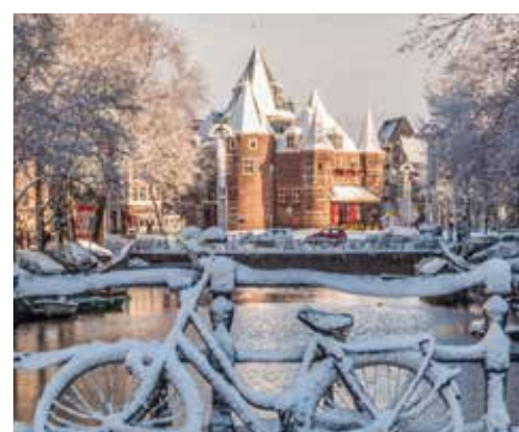
Winter in Amsterdam