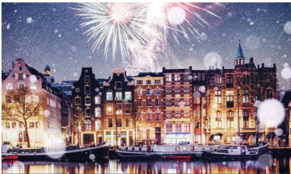
Silvester in Amsterdam