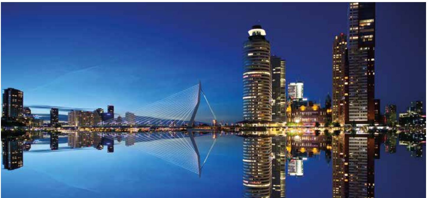
Die „Erasmusbrug“ (Erasmusbrücke) ist eines der Wahrzeichen von Rotterdam