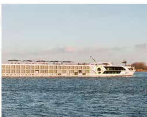
MS INSPIRE – Für vollendete Feiertage